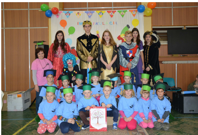
1. A trieda